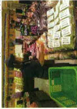
スーパーでの品出し