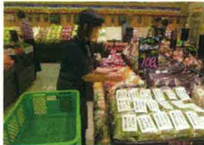
スーパーでの品出し